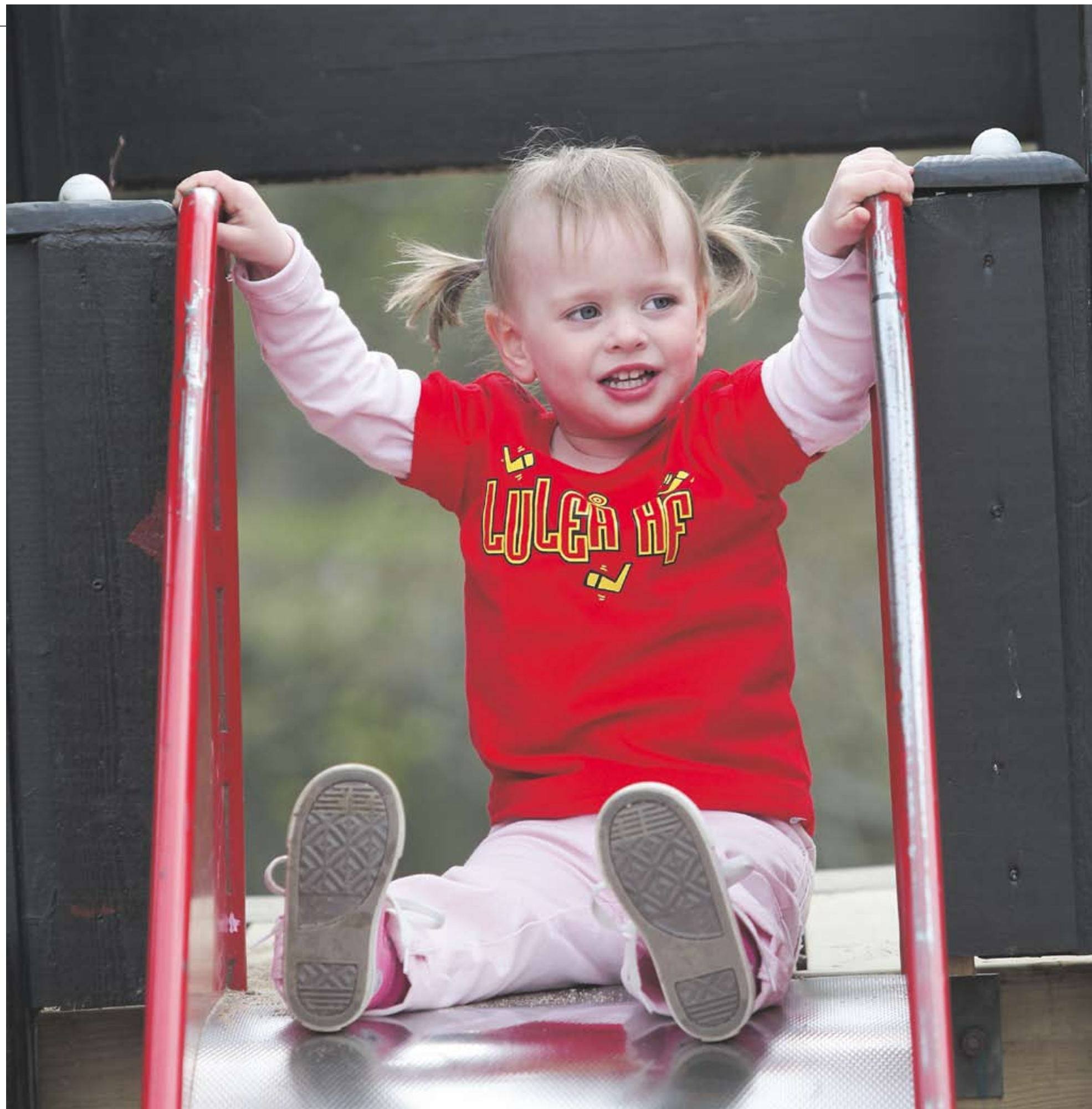
▲ Bebisen vars föräldrar tog strid för att hon skulle få döpas till Luleå har nu vuxit upp. I alla fall en smula. I dag bor hon med sin mamma sin pappa och sina tre syskon mitt i centrala Göteborg.