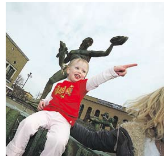
▲ Luleå nekades först namnet med motiveringen att man var rädd för att det skulle leda till obehag.