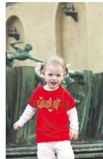
▲ Luleå hockey skickade en tröja till sin namne.