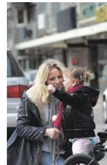
▲ Hela två år har lilla Luleå hunnit bli.