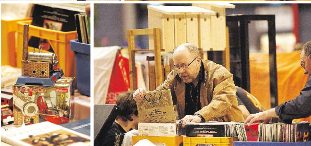
▲ Massor av prylar och massor av människor. På prylmässan finns det grejer för alla smaker – och ofta till ordentligt bra priser. En möjlighet för alla som är på jakt efter det stora klippet eller för dig som helt enkelt bara gillar att strosa omkring och betrakta.