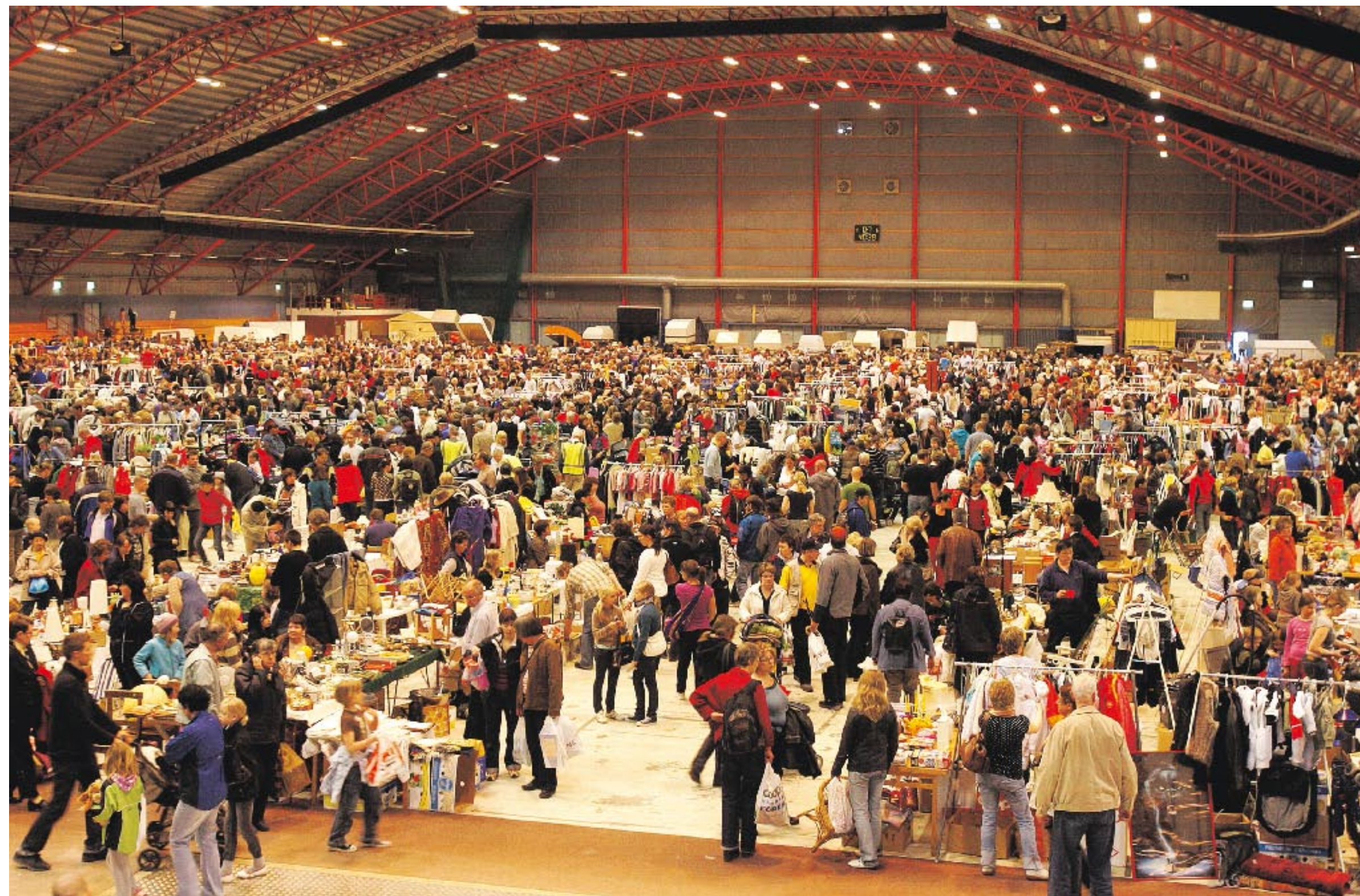
▲ Prylmarknaden i Arcushallen har blivit en succé och enligt arrangören är det den största i Sverige. Bilden är från marknaden i maj. I helgen är det dags för höstupplagan.