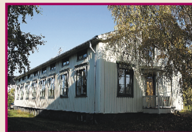
▲ En gång i tiden var Hanssons café starkt förknippat med Råneå. Caféet är sedan länge nedlagt men huset finns kvar.