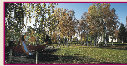
▲ Råneås park har i kommunens händer fått ett fint ansiktslyft.