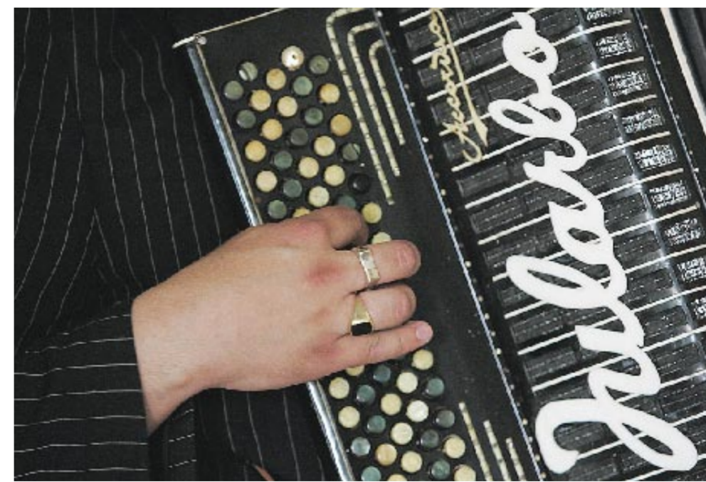
▲ Accordiaspelet från Hagström som Carl Jularbo en gång spelade på bär också spår av snus mellan knapparna. Ett kännetecken eftersom Jularbo-Calle var en snusare av stora mått.