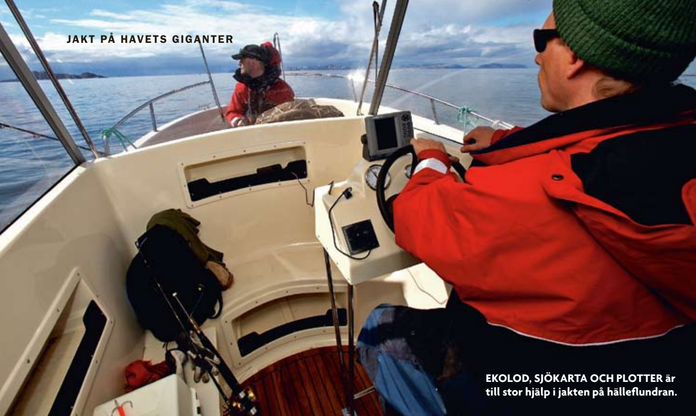
EKOLOD, SJÖKARTA OCH PLOTTER är till stor hjälp i jakten på hälleflundra.

▶ sätta den kraftiga huggkroken i fisken. Vågen visade på 16,5 kilo, så även om det inte var den största hälleflundra som fångats, innebar det en hejdlöst rolig kamp.