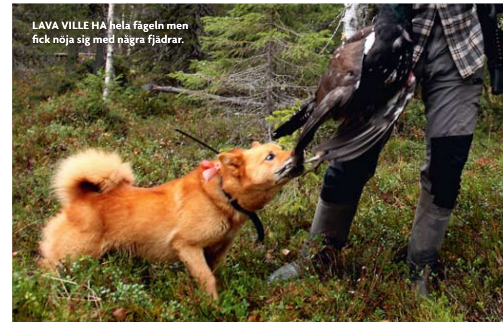
LAVA VILLE HA hela fågeln men fick nöja sig med några fjädrar.

”Tjädern trivs i riktig gammelskog och det är skönt att bara vistas i den miljön