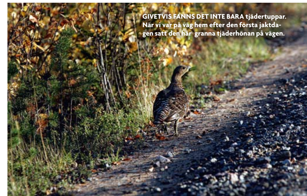
GIVETVIS FANNS DET INTE BARA tjädertuppar. När vi var på väg hem efter den första jakt dagen satt den här granna tjäderhona på vägen.