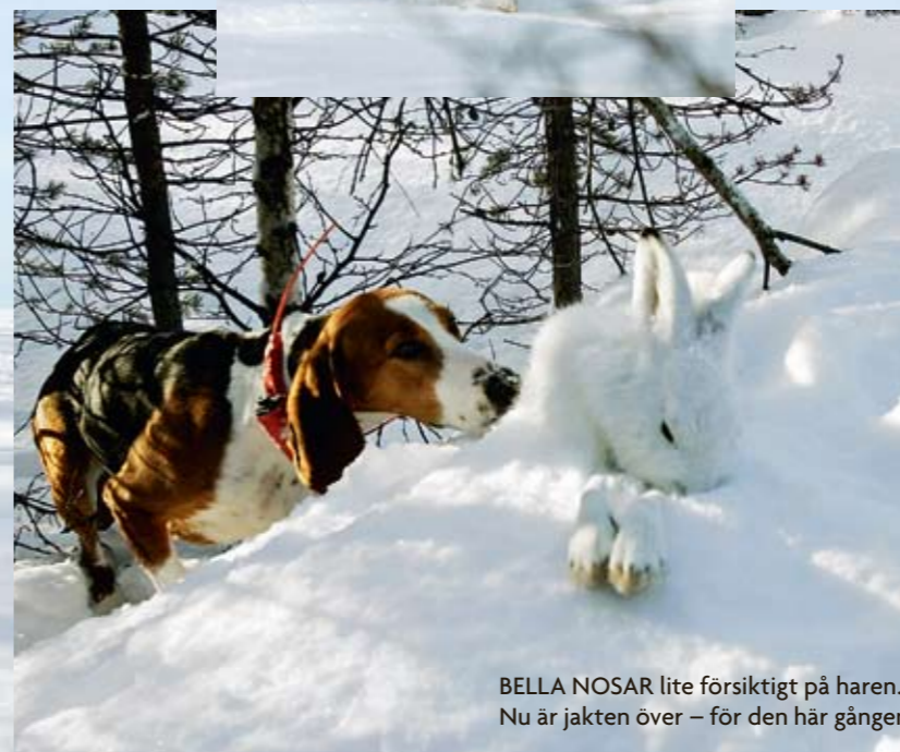
BELLA NOSAR lite försiktigt på haren. Nu är jakten över – för den här gången.