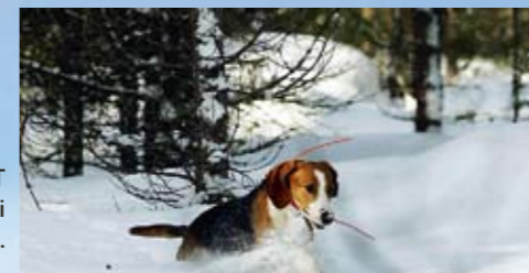
BELLA PÅ JAKT efter nya harar i Haparanda.

”Med gracila galoppsteg tog sig Bella fram genom det tre decimeter tjocka snölagret”