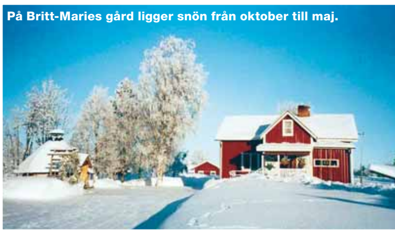
På Britt-Maries gård ligger snön från oktober till maj.