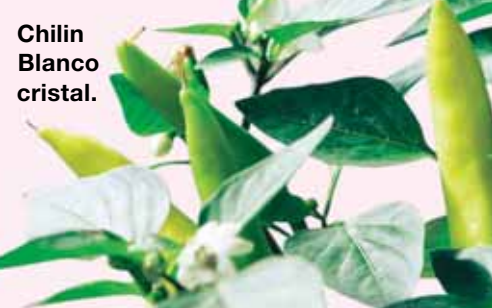
Chilin Blanco cristal.