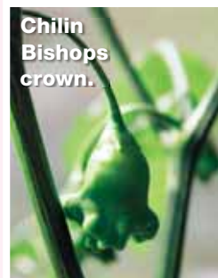
Chilin Bishops crown.