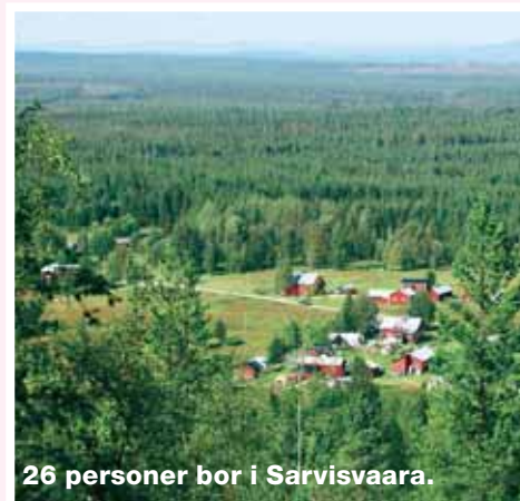
26 personer bor i Sarvisvaara.