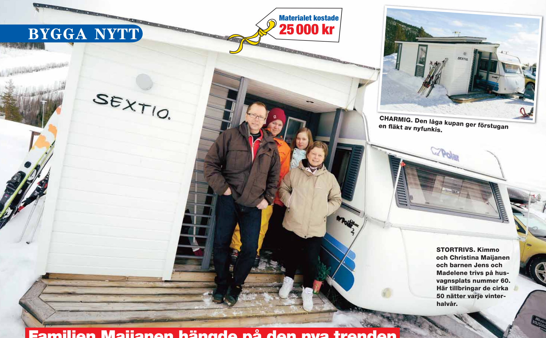
CHARMIG. Den låga kupan ger förstugan en fläkt av nyfunkis.