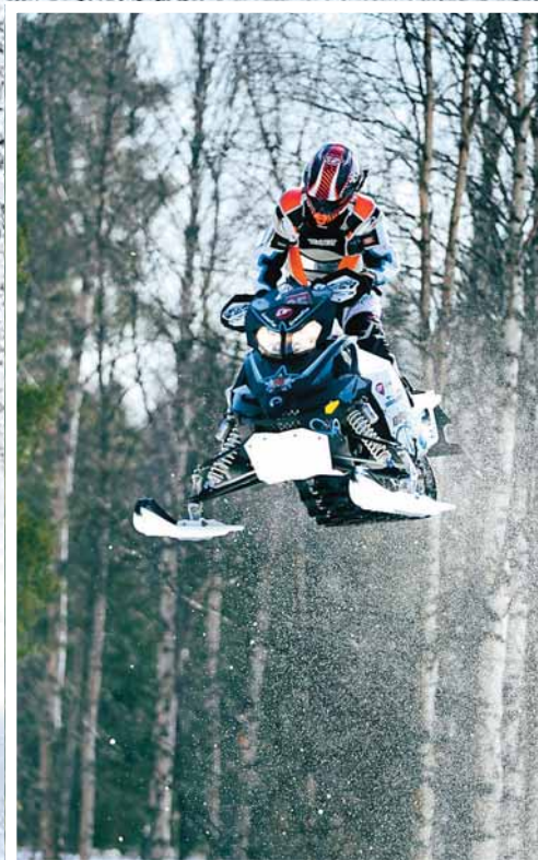
FARLIGT. En felbedömning i ett hopp kan göra att olyckan är framme.