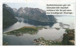
Golfströmmen gör att klimatet blir mycket mildare här än på samma breddgrad i Sverige.

5. Hurtigruten Folv skuter trafikerar Hurtigruten och en färd innebär god mat, sign mjölk och helt unik natur.