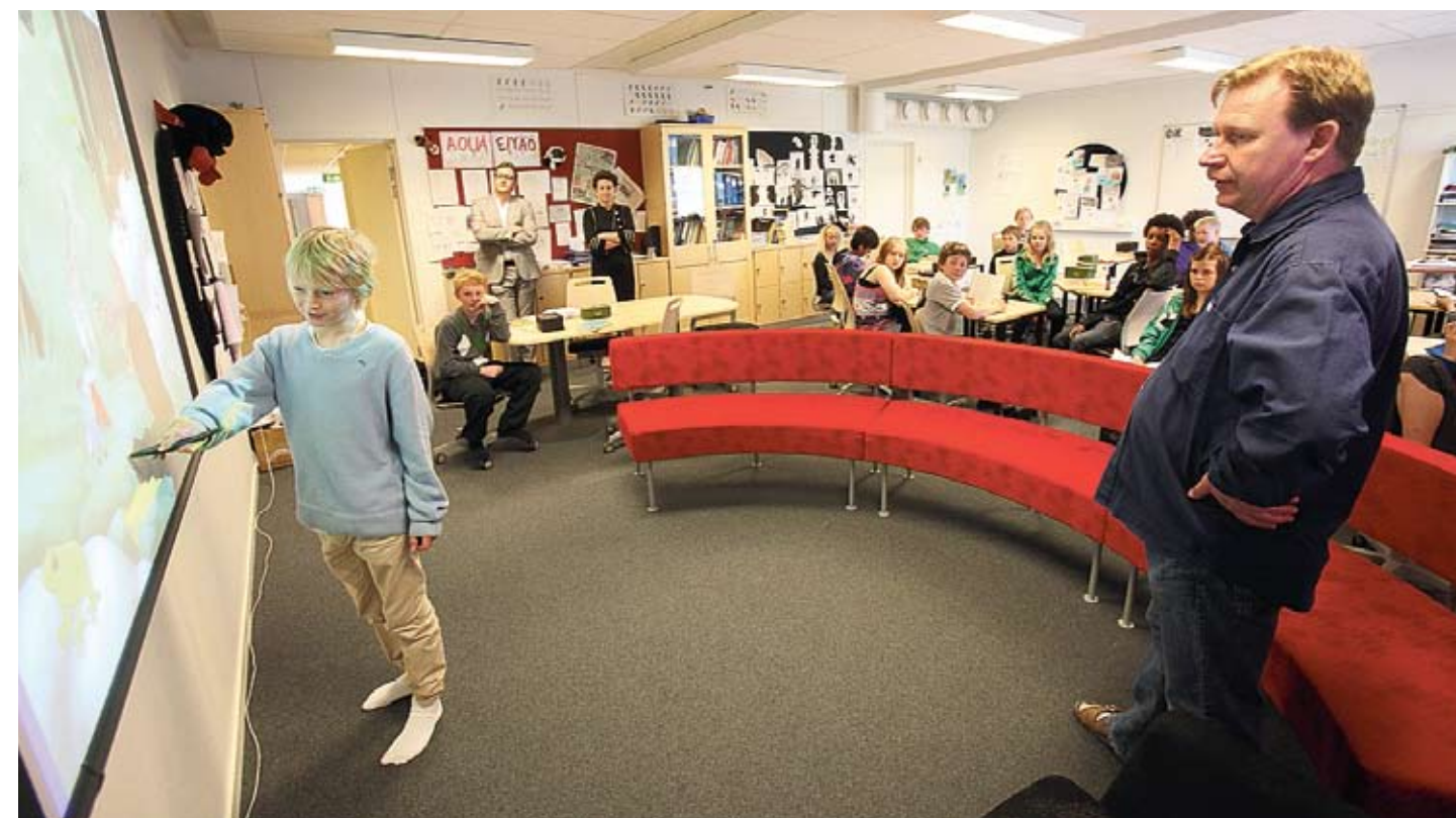
KLASS 5a vid Stadsöskolan i Gammelstad blev först av skolans mellanstadieklasser med att få ett nytt och fräschare klassrum.

Varje klassrum har kostat cirka 100 000 kronor att inreda och Anita Fagervalls plan är att under några år investera så att till sist samtliga skolans 22 klassrum håller samma standard. Och Lundbäcks inredningar har redan fått förfrågningar från flera kommuner runt om i Sverige. En av