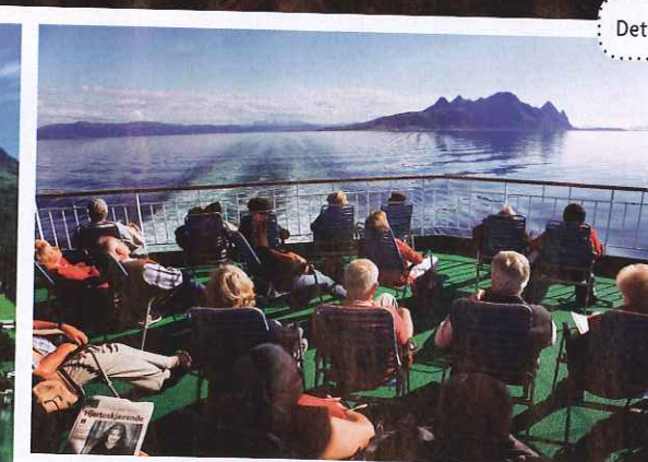
Det är inte alltid spegelblankt på fjordarna...