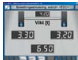
- vid lastsimulering