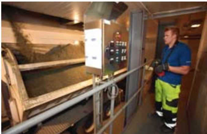
Med det nya systemet lastas Goliat snabbt till en totalvikt på 144 ton.

MEN ARBETET SOM ÅKARE I AITIKGRUVAN är inte alltid behagligt. Det nya anriktningsverket ligger på hög höjd och där finns inga träd som hindrar vinden.