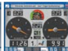
- vid bromsprov